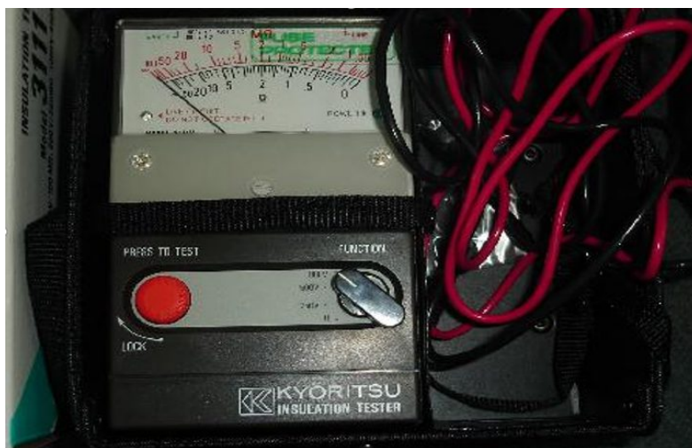
A Kyoritsu Insulation Tester

توصیه : در صورت خرابی یکی از خازن های سرامیکی در مدار، بهتر است یک خازن سرامیکی با ولتاژ بالاتر جایگزین گردد.